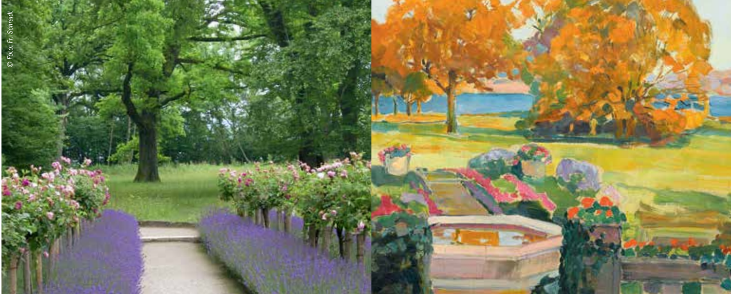
Der Garten des Künstlerhauses