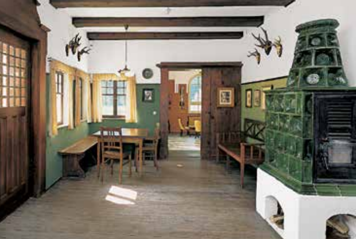
Bauernstube mit Ausstattung aus der Gründerzeit um 1908

Im Wohnzimmer des Hauses – einer Mischung aus Bauernstube und Jagdzimmer – ist die wandfeste Ausstattung von 1908 noch erhalten: Holzbalkendecke, Wandvertäfelung, Kachelofen und Eckbank. Die Möblierung wurde soweit möglich rekonstruiert. Fotos zu Leben und Werk von Mathias und Anna Gasteiger lassen die Zeit um 1900 lebendig werden. Der 1912 fertiggestellte Salon des Hauses ist ein verhältnismäßig großer, saalartiger Raum mit gewölbter