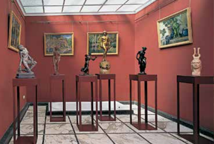
Das ehemalige Bad mit Werken des Künstlerehepaares

Zeit, mit ruhigen, neoklassizistischen Zügen. Die feingliedrige Statuette »Weibliches Fabelwesen« – eine weibliche Halbfigur mit dem Körper einer Hirschkuh – greift ein von der antiken Mythologie abgeleitetes Thema auf. Zwei kleine Bildwerke mit Karikaturen der Feinde Deutschlands, die 1914 im Anschluss an zwei Titelblätter der Zeitschrift »Simplicissimus« entstanden sind, betonen wie bei vielen Künstlern der Weltkriegszeit das nationale Element.