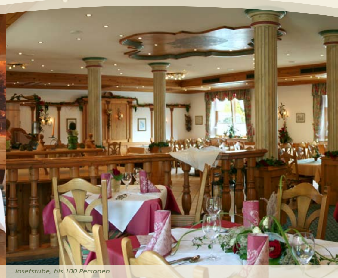
Josefstube, bis 100 Personen