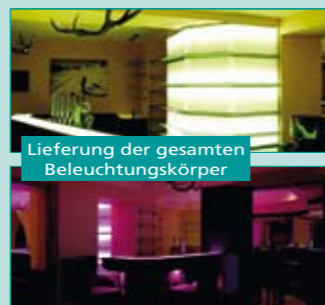
Lieferung der gesamten Beleuchtungskörper