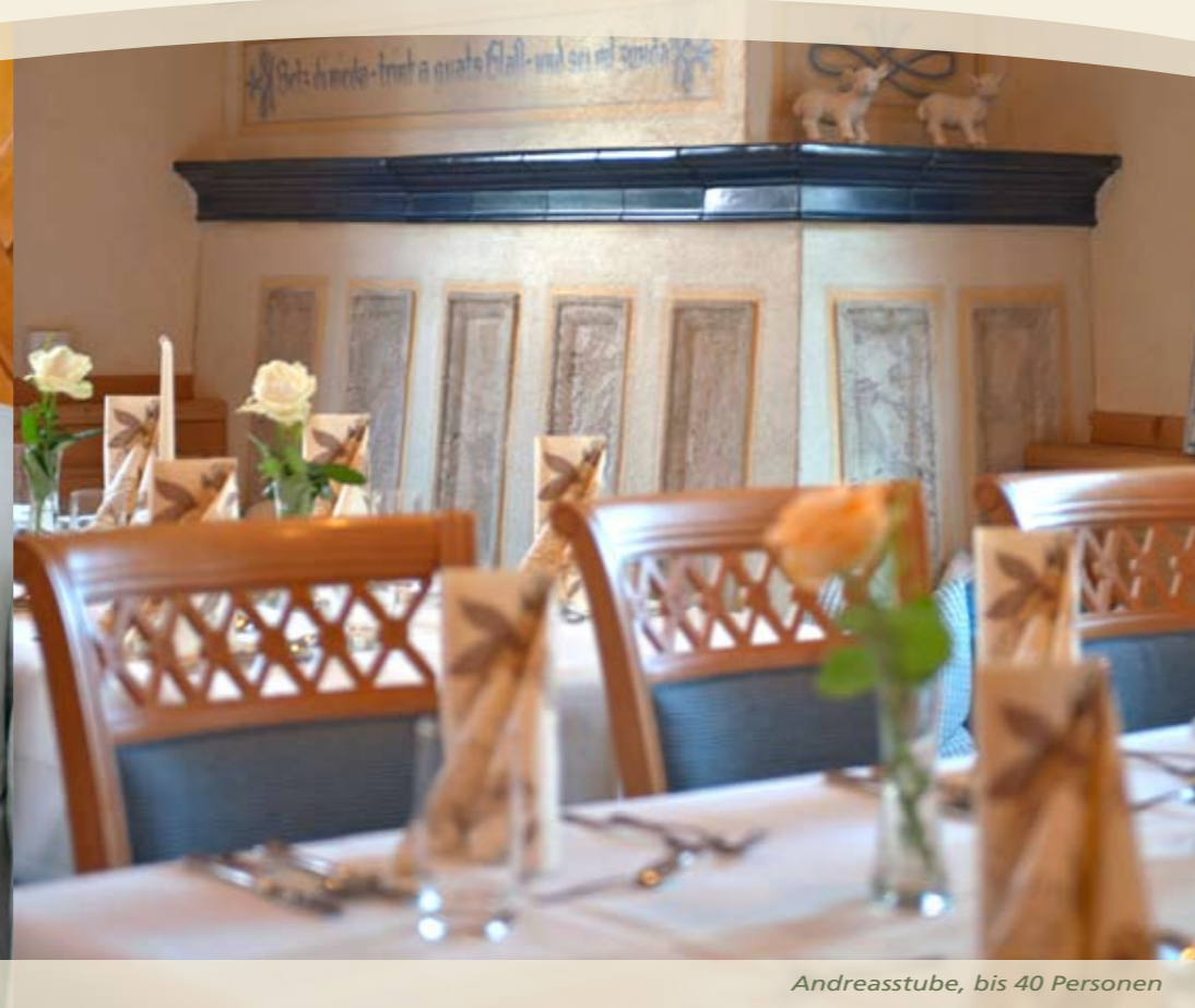
Andreasstube, bis 40 Personen