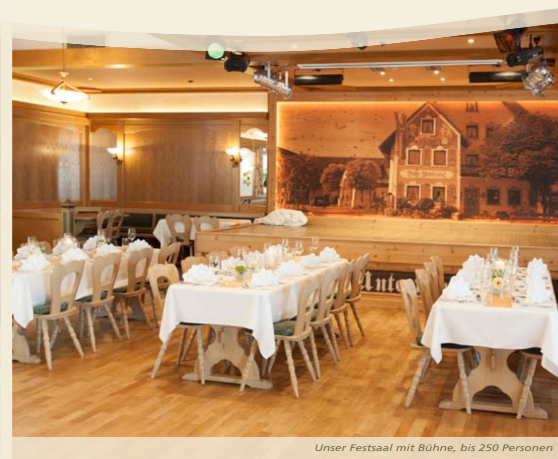
Unser Festsaal mit Bühne, bis 250 Personen