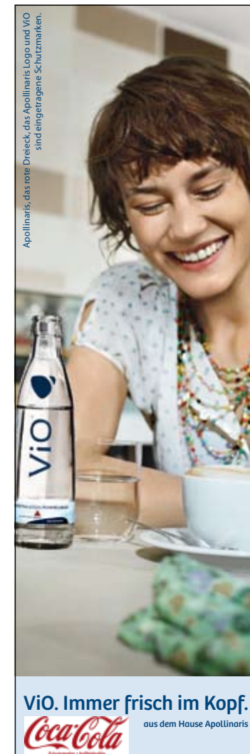
Apollinaris, das rote Dreieck, das Apollinaris Logo und ViO sind eingetragene Schutzmarken.

Heimbs Kaffee GmbH & Co. KG Rebenring 30 38106 Braunschweig Tel. +49-531. 38 002 154 Fax +49-531. 38 002 153 E-Mail Adresse: info@heimbs.de www.heimbs.de